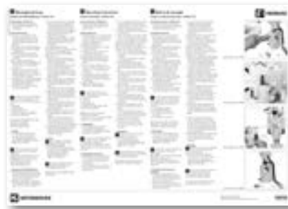
Nur die Pumpeneinheit im Fördermodul wird gewechselt.

Der einfache Austausch ist in der Montageanleitung (der Pumpe beiliegend) anschaulich beschrieben.