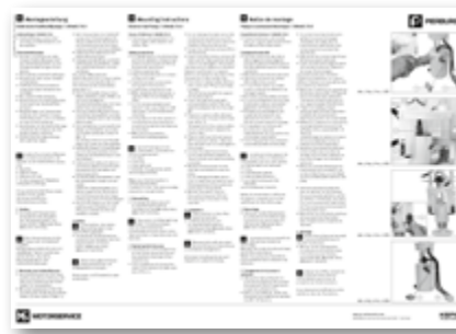
Seule la pompe est remplacée dans le module d'alimentation en carburant.

Le remplacement simple est clairement décrit dans les instructions de montage (jointes à la pompe).