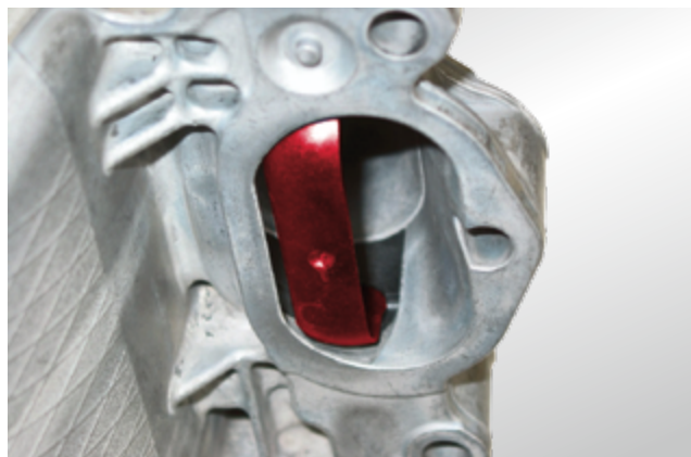
Válvula de turbulencia (resaltada en rojo) para el servicio con carga estratificada