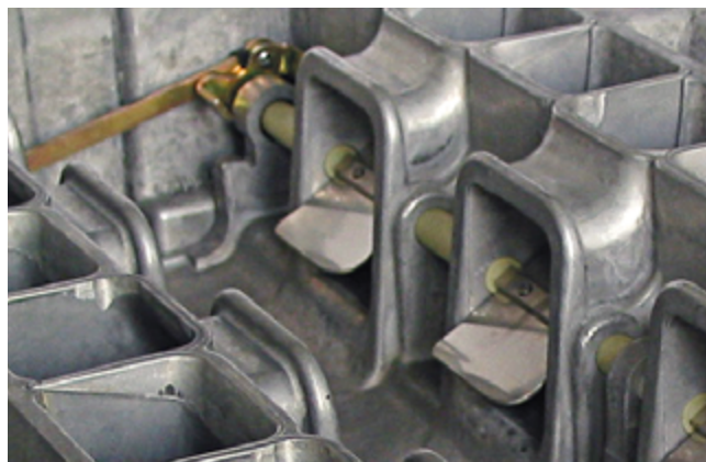
Uno sguardo all'interno di un collettore di aspirazione a geometria variabile