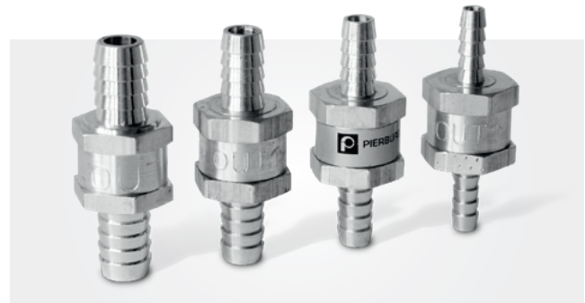
燃油止回阀 6–12 mm