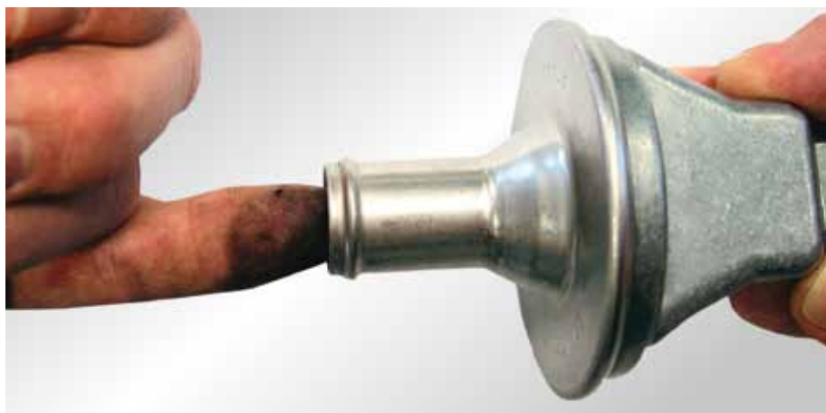
A visszacsapó szelep egyszerű vizsgálata

A változtatások jogát fenntartjuk. Az ábrák a valóságtól eltérhetnek. A besorolást és a pótlási lehetőségeket lásd a mindenkor érvényes katalógusban, a TecDoc-CD-n, ill. a TecDoc-adatokra alapozott rendszerekben.