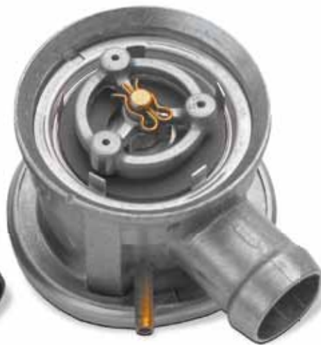
Hasonlítási alap: Új állapot

Ez a károsodás legtöbb esetben füstgázkondenzátum lecsapódásából ered. Javításkor gyakran csak a szekunderlevegő-szivattyút cserélik ki.