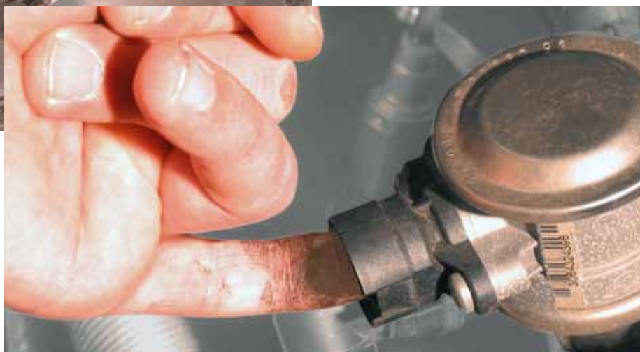
A BMW 520i szekunderlevegő-szelepének gyorsvizsgálata (kiemelve)