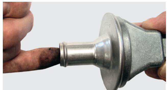
Fig. 1: Simples verificação da válvula de retenção

A causa do dano continua no veículo pode causar uma nova falha da bomba de ar secundário. Basicamente, na substituição de uma bomba de ar secundário, a válvula de comutação de acionamento e a válvula de ar secundário devem ser verificadas quanto a vazamento.