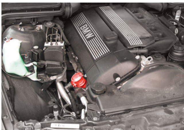
Duas variantes do sistema de ar secundário

Válvulas de ar secundário são componentes do sistema de ar secundário. Elas são montadas entre a bomba de ar secundário (01) e o coletor de escape. Elas impedem que picos de pressão no coletor de escape causem danos no sistema de ar secundário e que o gás de escape ou o condensado chegue na bomba de ar secundário.