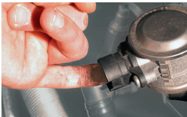
Verificação rápida da válvula de ar secundário em um BMW 520i (em destaque)

As válvulas de retenção de ar secundário (05) abrem-se pela pressão do fluxo de ar secundário.