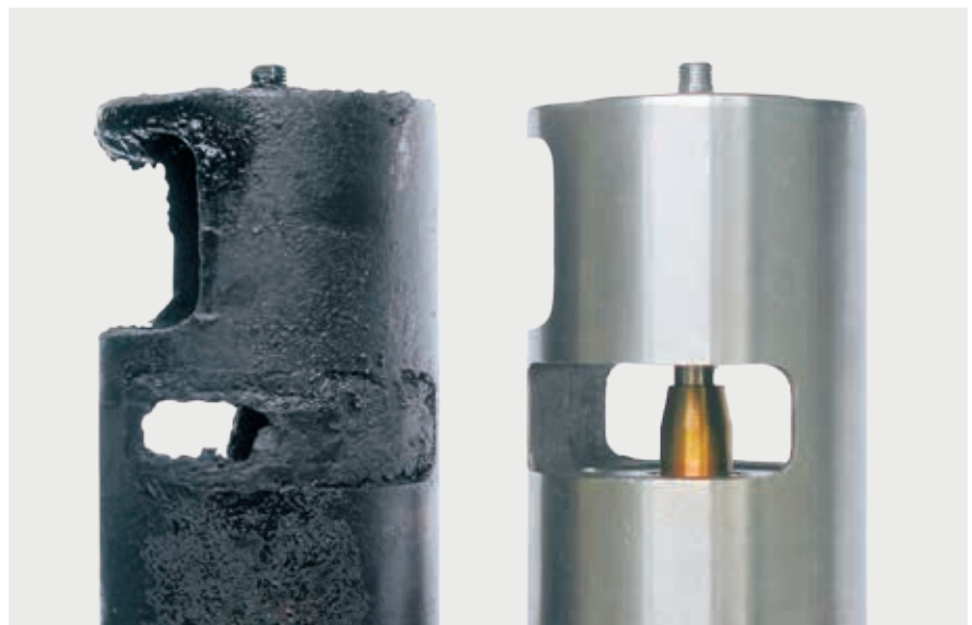
Soupapes EGR encrassée et à l'état neuf

Pour les remarques concernant le diagnostic et les causes possibles, cf. pages suivantes