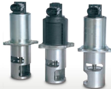
Vue du produit (extrait)

Sous réserve de modifications et de variations dans les illustrations.