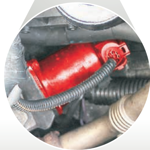
Soupape EGR dans Renault Master JD1M (mis en valeur)