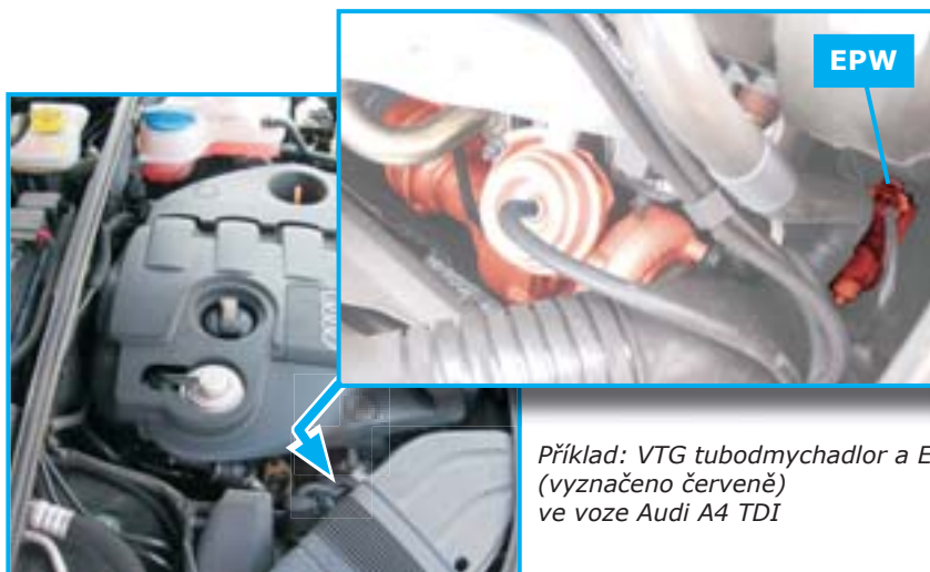
Příklad: VTG turbodmychadlor a EPW (vyznačeno červeně) ve voze Audi A4 TDI