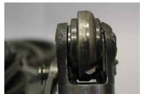
Imagem do dano: roldana desgastada de um lado

O cesto de montagem (3) não pode voltar a ser instalado depois da montagem de uma bomba de vácuo nova.