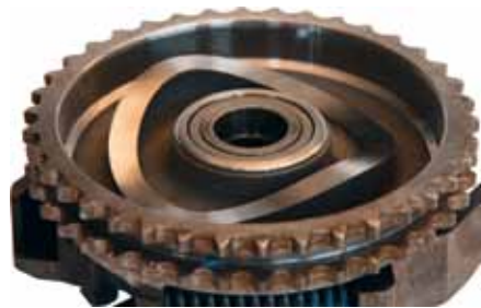
Excêntrico em bom estado

As bombas de vácuo são componentes de segurança, por isso a sua montagem e desmontagem só pode ser feita por pessoal especializado!