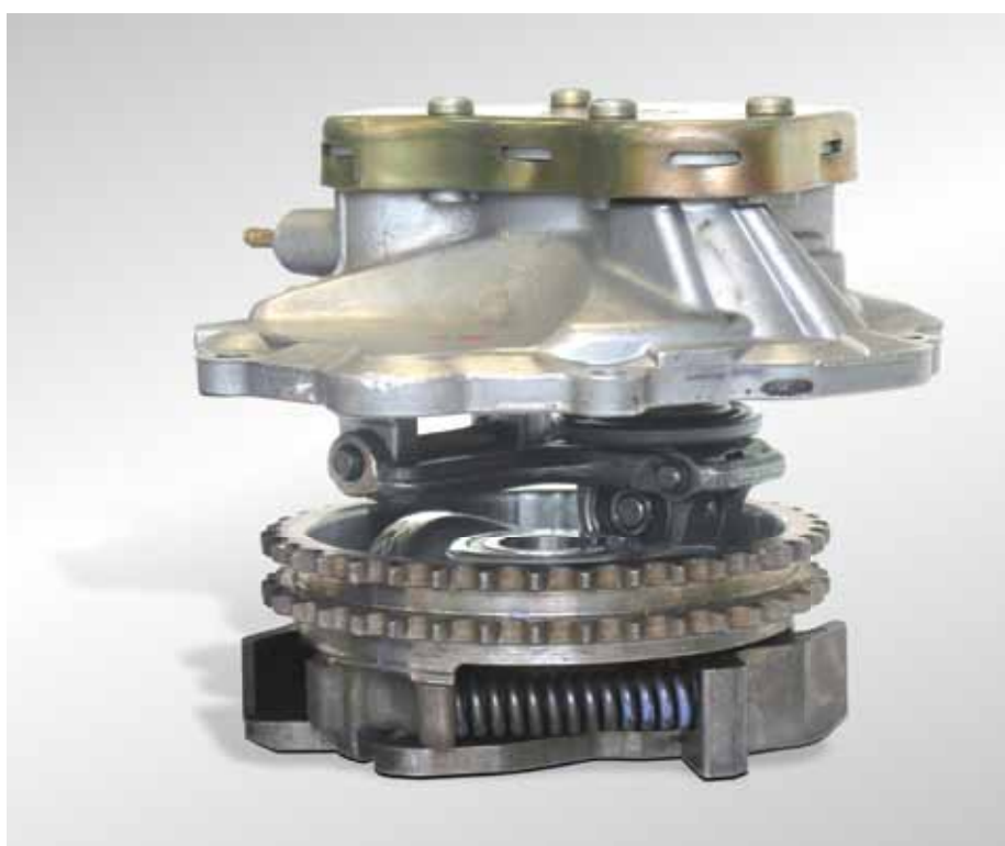
Bombas de vácuo da série 7.20607... (em cima) no regulador de injeção

Até por volta de meados da década de 90, o excêntrico no regulador de injeção podia ser substituído em separado. Hoje o regulador de injeção só pode ser substituído juntamente com o excêntrico.