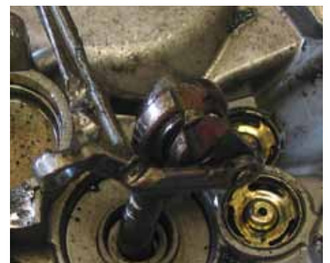
Imagem do dano: balanceiro completamente destruído