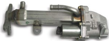
Şekil 1: EGR soğutuculu EGR valfi

EGR soğutucularda motor soğutma maddesi, soğutma suyu olarak görev görür. Soğutucular, paslanmaz çelikten veya alüminyumdan üretilir. Elverişsiz veya öngörülmemiş çalışma durumlarında (örneğin motor, çok fazla kükürt içeren yakıt veya biyo yakıt ile çalıştırıldığında) daha fazla miktarda agresif yanma ürünleri oluşabilir. Bunun sonucunda uzun sürelerin ardından yavaşça ilerleyen soğutma maddesi kaybı ile birlikte dahili sızıntılar söz konusu olabilir. Su kaybının sebebi tespit etmeye çalışıldığında sıklıkla silindir kapağı contaları, silindir kapakları veya ıslak silindir gömleklerinin contaları değiştirilir, ancak bu sorunu çözmez.