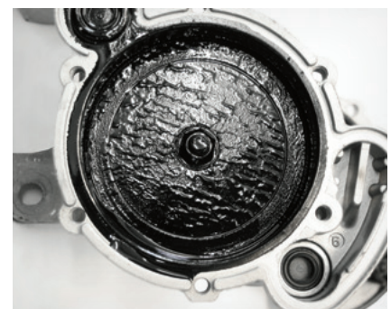
Fig. 3: A borra de óleo na bomba de vácuo do VW Transporter provoca ruídos de vibração

Em caso de depósitos de borra de óleo, a bomba de vácuo tem de ser substituída. A limpeza não é possível, uma vez que a bomba de vácuo não pode ser aberta com as ferramentas habituais e não há peças de reposição. Pode ocorrer uma reclamação semelhante, se for montada uma bomba de vácuo errada com tucho demasiado curto (03).