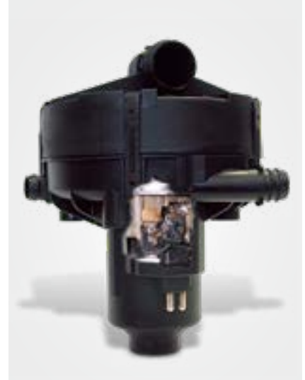
Eriye izlerinin olduęu sekonder hava pompasına yakından bakıř (kesit)

manifoldunda doęrudan egzoz valflerinin arkasına oksijen bakımından zengin ortam havası (sekonder hava) üflenir. Bu sayede zararlı maddelerde ardıl oksidasyon (sonradan yanma) gerekleşir ve karbondiyoksit ile su aıęa ıkar. Burada oluřan ısılar ilave olarak katalitik konvertörü ısıtır ve lambda regülasyonu kullanımına kadar olan süreyi kısaltır.