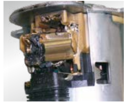
Hasar belirtisi: Elektromotorda veya elektrikli kontaklarda erime izleri

Değişiklik yapma ve farklı resim kullanma hakkı saklıdır. Parça seçimi ve yedek parçalar için ilgili geçerli kataloğa veya TecAlliance tabanlı sistemlere bakınız.