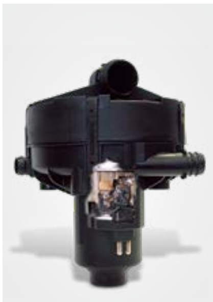
查看二次空气泵内部 (剖面) 带有熔痕