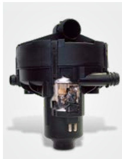
Widok wnętrza pompy powietrza wtórnego (przekrój) ze śladami nadtopienia

zaworami wylotowymi bogate w tlen powietrze z otoczenia (powietrze wtórne). Dzięki temu może nastąpić dopalenie (dopalenie) substancji szkodliwych, w wyniku czego powstaje dwutlenek węgla i woda. Generowane przy tym ciepło dodatkowo nagrzewa katalizator i skraca czas potrzebny do zadziałania systemu regulacji wartości lambda.