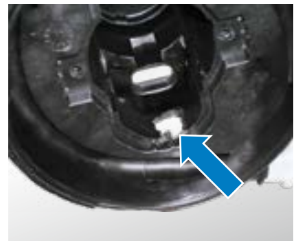
Obraz uszkodzenia: ślady nadtopienia na obudowie (patrząc od góry do wewnątrz obudowy)