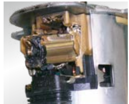
Obraz uszkodzenia: ślady nadtopienia na silniku elektrycznym albo na stykach elektrycznych

Prawo do zmian i odchyłeń rysunków zastrzeżone. Przy porządkowaniu i części zastępcze patrz obowiązujące katalogi lub systemy oparte na danych TecAlliance.