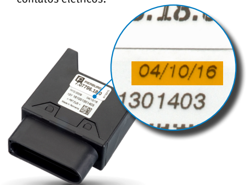
Fig. 1: Versão de software impressa

Os componentes elétricos podem ser danificados por carga eletrostática. Por isso, nunca toque diretamente nos contatos elétricos.