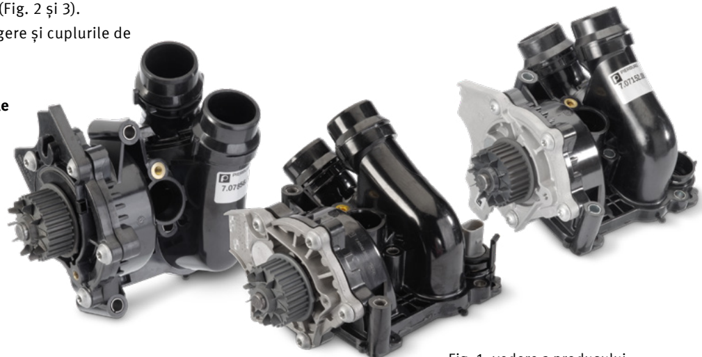
Fig. 1: vedere a produsului

Ne rezervăm dreptul efectuării unor modificări și ne asumăm existența unor diferențe în cazul figurilor. Pentru alocare și pentru piesele de schimb, consultați cataloagele valabile în fiecare caz în parte, respectiv sistemele bazate pe TecAlliance.