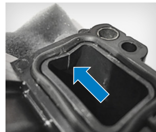
Fig. 2: spargere (situație de fapt)

Respectați astfel obligatoriu instrucțiunile de montaj atașate.