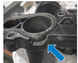
Fig. 3: spargere (situație de fapt)