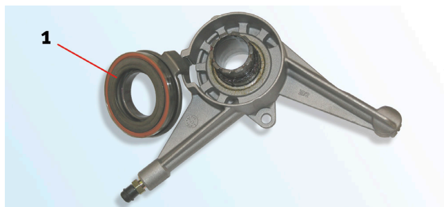
Снимка 1: 510 0016 10

Производител: Volkswagen Модел: Transporter (T4), MJ. 09.95 – 09.03 LuK AS Артикулни номер: 510 0016 10 OE номера: 02F 141 671 A 02F 141 671 B