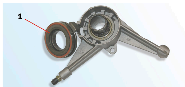
Obrázek 1: 510 0016 10

Výrobci: Volkswagen Model: Transporter (T4), MJ. 09.95 – 09.03 LuK-AS-č.: 510 0016 10 OE čísla: 02F 141 671 A 02F 141 671 B