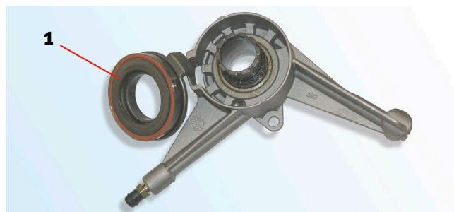
Εικόνα 1: 510 0016 10

Κατά την τοποθέτηση του υδραυλικού ρουλεμάν συμπλέκτη πρέπει να προσέξετε, ότι το ρουλεμάν πίεσης (1) έχει την πλακέ πλευρά προς το συμπλέκτη!