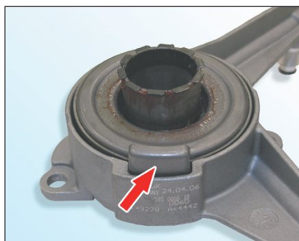
Fig. 2: Incorrecto

¡Observar las indicaciones del fabricante del vehículo!