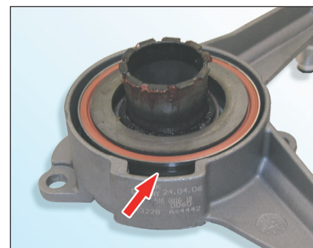
Fig. 3: Correcto

Para evitar daños en el embrague y en la caja de velocidades, así como caras reparaciones adicionales, es necesario comprobar el asiento correcto del cojinete de presión en el dispositivo central de desembrague (ver fig. 3 ).