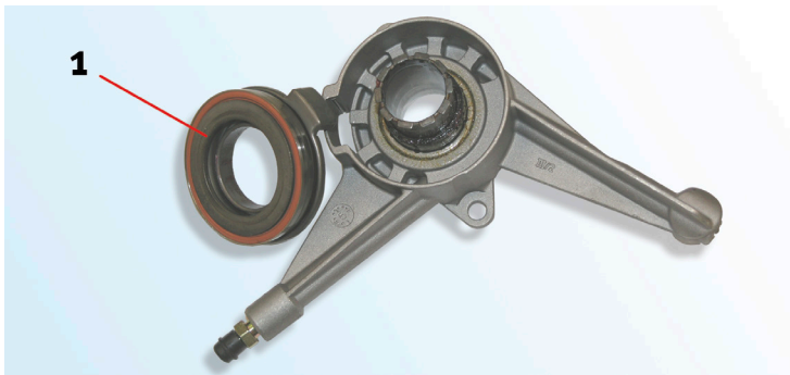
איור 1: 10 0016 510