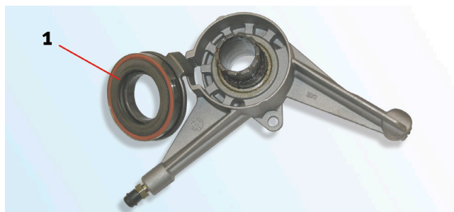
1. ábra: 510 0016 10