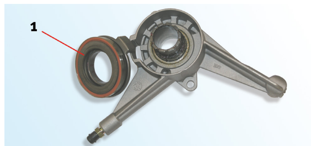
Figur 1: 510 0016 10