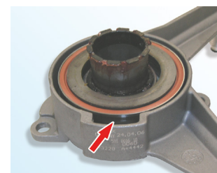
Figur 3: Riktig

Ved montering av CSC, sørg for at den flate siden til utløserlagret (1) er mot clutchen.