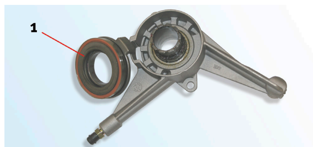
Рисунок 1: 510 0016 10

Производители: Volkswagen Модель: Transporter (T4), MJ. 09.95 – 09.03 Арт. номер: 510 0016 10 ОЕ номера: 02F 141 671 A 02F 141 671 B