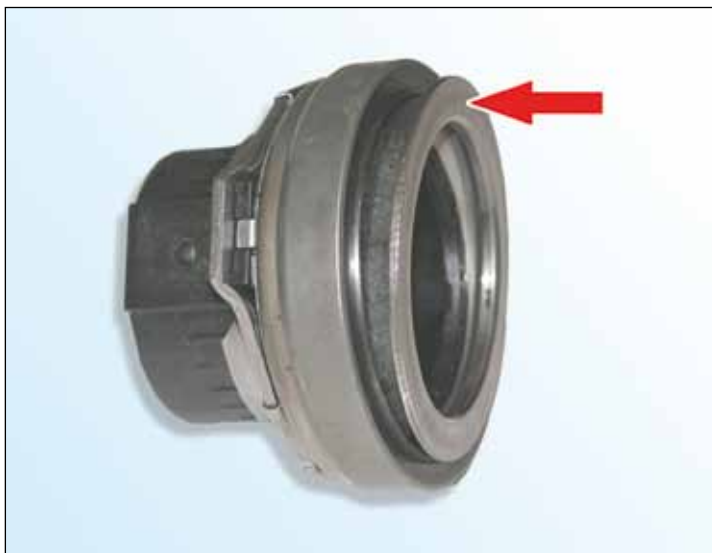
Slika 1: 500 0035 10