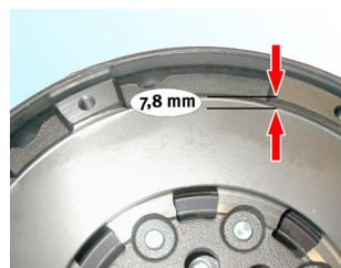
εικόνα 1: 415 0151 10 (παλαιά έκδοση BDM)

Schaeffler Greece schaefflergr@schaeffler.com https://aftermarket.schaeffler.gr www.repxpert.gr