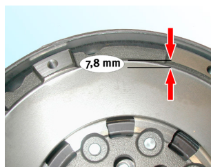
Рисунок 1: 415 0151 10 (старая версия DMF)

ООО “Шэффлер Руссланд” +7 (495) 737 76 60 aftermarket.ru@schaeffler.com aftermarket.schaeffler.ru www.repxpert.ru