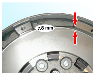
Bild 1: 415 0151 10 (tidigare version av dubbelmassesvängghjul)