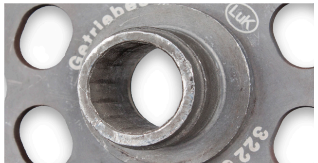
Εικόνα 2: Κατεστραμμένο προφίλ του καρτέ

Σε εξαιρετικές περιπτώσεις, το προφίλ καρτέ στον δίσκο συμπλέκτη μπορεί να υποστεί ζημιές από αυτήν τη διαδικασία. Αν συμβεί αυτό, δεν θα μεταφέρεται πλέον ισχύς (βλέπε εικόνα 2).