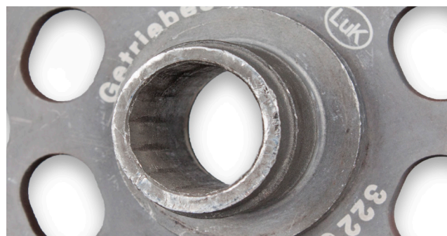
Fig. 2: Profilul canelurilor este deteriorat

În anumite circumstanțe specifice, este posibil ca profilul canelurii de pe discul de ambreiaj să fie deteriorat prin acest proces; în cazul în care se întâmplă acest lucru, nu va mai avea loc transferul de putere (a se vedea imaginea 2).