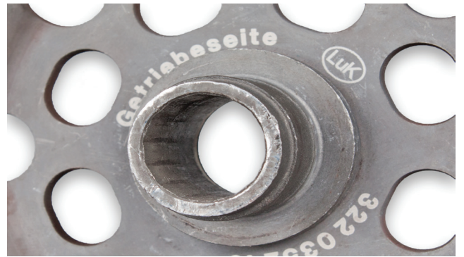
Resim 2: Hasar görmüş freze profili

Bu olursa DMF düzgün çalışmayabilir. Bütün motor döner titreşimleri nemiendirilmeden şanzımana / aktarma organına aktarılacaktır ve erken aşınma meydana gelecektir. Münferit durumlarda freze profili bu işleme zarar görebilir, bu durumda güç artık aktarılamayacaktır (bakınız Resim 2).