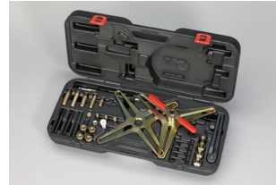
Resim 2: SAC özel servis takımı 400 0237 10

LUK SAC debriyajı otomatik olarak ayarlanabildiği için, baskı plakası montaj sırasında karşıt güç olmadan sağlama alınmalıdır. Ayarlama mekanizmasını tetikleyeceğinden ve debriyajın işlevini bozacağından dolayı baskı plakası diyafram yayın gücüne karşı vidalarla beraber kaldırılmamalıdır.