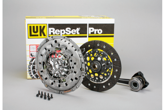
Resim 1: LuK RepSet® Pro 623 3105 33