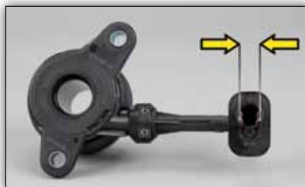
Slika 1: LuK CSC 510 0090 10 hidravlični priključek 12,2 mm

Št. LuK-AS: 510 0090 10 510 0097 10 510 0098 10 510 0137 10