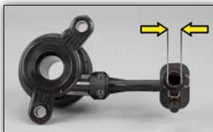
Slika 3: LuK CSC 510 0098 10 hidravlični priključek 11,7 mm