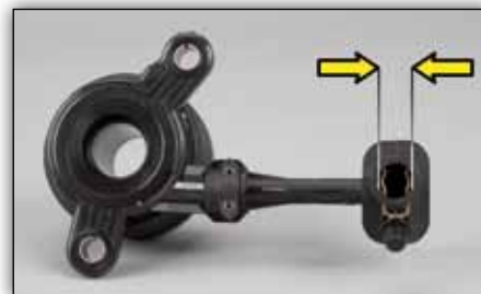
Slika 2: LuK CSC 510 0097 10 hidravlični priključek 13,3 mm