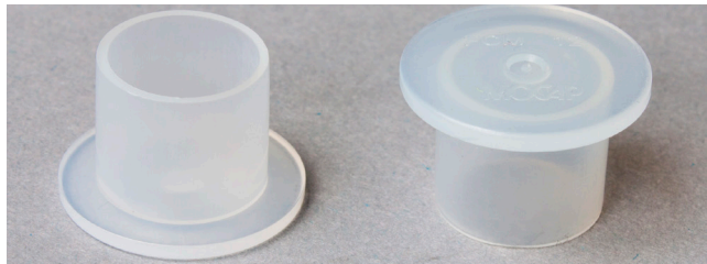
Снимка 2: Уплътняващи запушалки