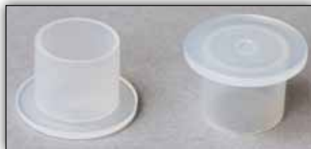
Slika 2: Brtveni čepovi

Poštujte specifikacije proizvođača vozila!