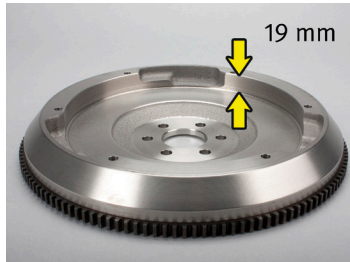
איור 1: מק"ט יצרן מקורי – 90536140/616169 ללא שיני הזחה מסביב בהיקף, עומק גלגל התנופה הוא 19 מ"מ

את המאפיינים השונים של 2 גלגלי התנופה המדוברים ניתן לראות באיור 1 ובאיור 2.