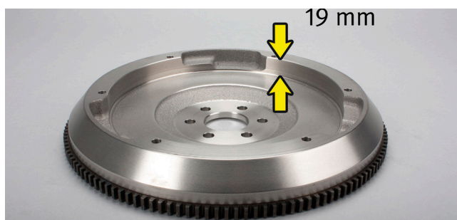
Fig. 1: Nr. OE 90536140/616169 fără amprentă circulară, adâncimea volantului: 19 mm