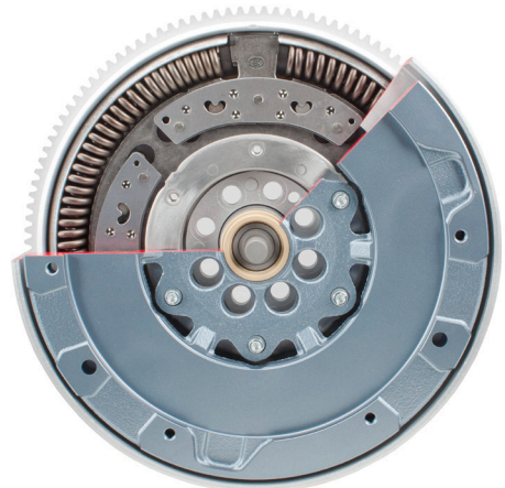
Billede 1: Dobbeltmassesvinghjul med centrifugalkraftpendul

LuK DMF: 415 0450 10 415 0477 10 415 0499 10 415 0554 10