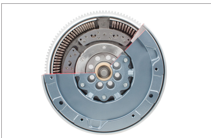
Fig. 1: Tweedelig vliegwiel met centrifugaalpendel in doorsnede

Het tweedelig vliegwiel (DMF) met centrifugaalpendel is een nieuwe ontwikkeling van het merk LuK. Met de bouwruimteneutrale integratie van beweegbare centrifugaalpendels wordt een verhoogde dempingscapaciteit bij lage motortoerentallen bereikt. Hierdoor kunnen nieuwe motorconcepten hun volledige potentieel ten aanzien van verbruik- en CO 2 -reductie optimaal benutten met behoud van het vertrouwde comfort.