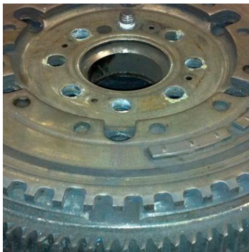
איור 2: טבעת החיישן מהסוג החדש