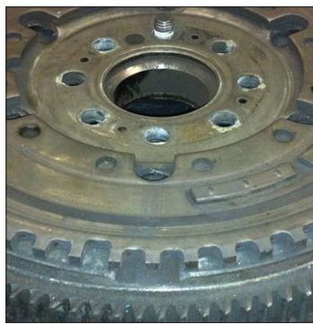
Fig. 1: Bestaande uitvoering impulsring