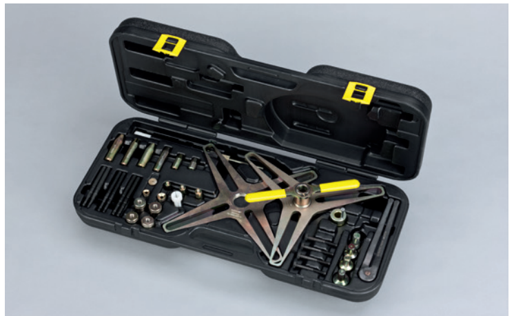
Fig. 2: La herramienta especial 400 0237 10 permite reparar el embrague de forma profesional

¡Observar las indicaciones del fabricante del vehículo!