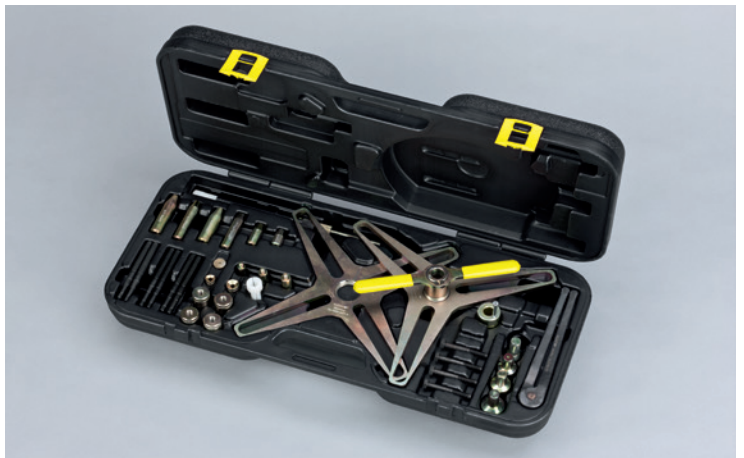
Fig. 2: Het speciale gereedschap 400 0237 10 maakt een professionele reparatie van de koppeling mogelijk

Neem altijd de aanwijzingen van de autofabrikant in acht.