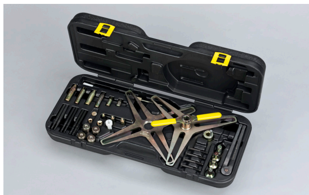
Fig. 2: Scula specială 400 0237 10 vă ajută să efectuați reparații profesionale

Pentru repararea și întreținerea ambreiajelor, Schaeffler Automotive Aftermarket recomandă întotdeauna utilizarea sculei speciale nr.: 400 0237 10. Instrucțiunile de utilizare se află pe situl www.rexpert.ro .