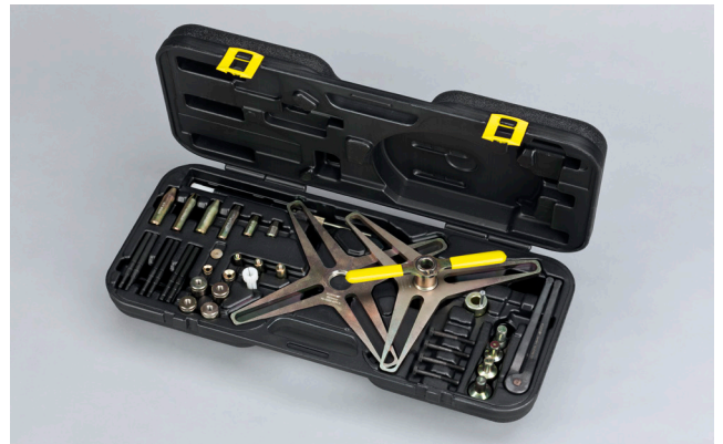
Зображення 2: Спеціальний інструмент 400 0237 10 дозволяє виконати професійний ремонт механізму зчеплення

Дотримуйтеся рекомендацій виробника транспортного засобу!