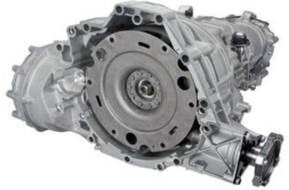
Resim 1: Debriyaj modülü monte edilmiş şanzıman

Bu çift kütleli volanın düzeneği ve tasarımı, 400 0080 10 Parça numaralı LuK özel servis takımı kullanılarak test edilmesine izin vermez! Debriyaj modülüyle ilgili daha fazla bilgi için lütfen www.rexpert.com.tr adresini ziyaret edebilirsiniz.