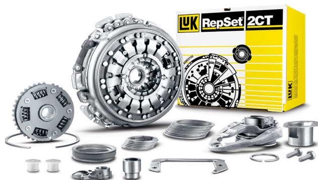
Obrázek 2: LuK RepSet 2CT

Tabulka (obrázek 3) porovnává předchozí a novou sadu vymezených podložek a její složení tak, aby bylo dosaženo nastavovacích rozměrů.1