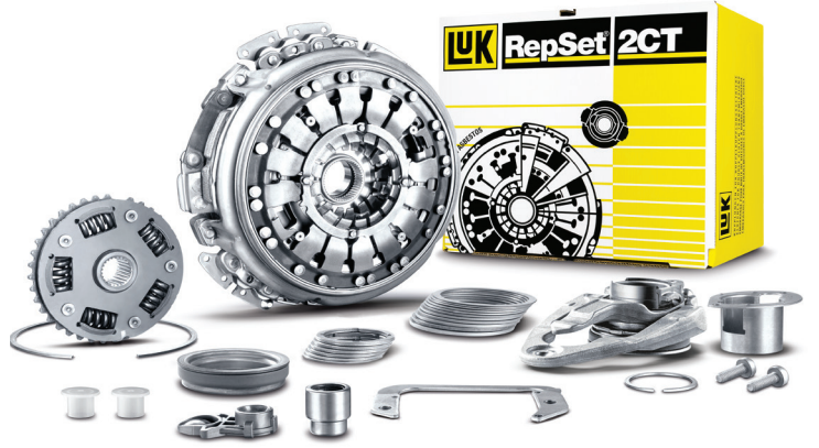
Resim 2: LuK RepSet 2CT