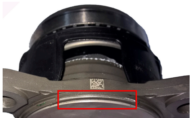
Εικόνα 2: Υδραυλικό ρουλεμάν που έχει υποστεί ζημιά και έχει αποκολληθεί η στεγανοποιητική του βάση